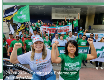
28-06-2024 - Caminha da Enfermagem