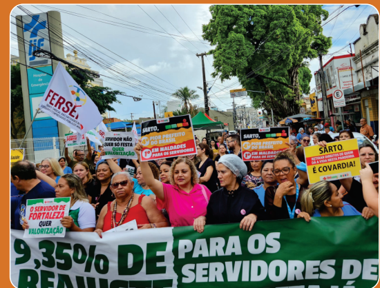
06-03-2024 - Ato em frente ao IJF