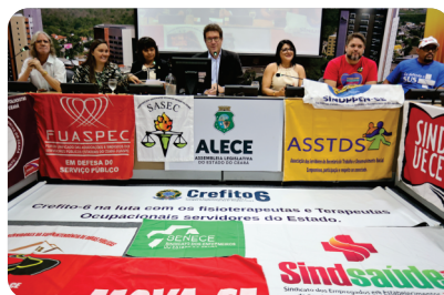
28-11-2024- Debate da Campanha Salarial de 2025 dos Servidores do CE