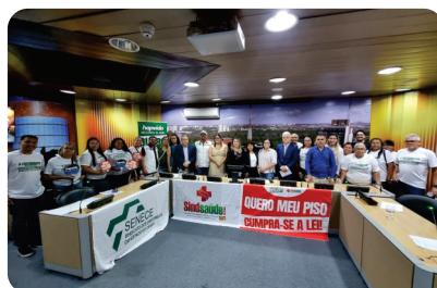
18-12-2024- Discussão do Piso Salarial dos Profissionais de Enfermagem da Rede Privada do CE