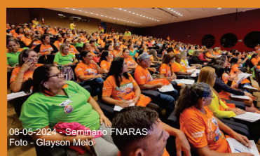
08-05-2024 - Seminário FNARAS

Outro marco foi a participação do Sindsaúde no 2º Seminário Nacional do FNARAS, em Brasília, que reuniu caravanas de 22 estados. Durante o evento, com uma delegação de 54 representantes cearenses, debates focaram na aposentadoria especial, despreciação do vínculo e aprovação de projetos como a PEC 14, reforçando a luta pelos direitos dos ACS e ACE.