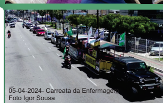
05-04-2024 - Carreata da Enfermagem