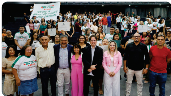
11-10-2024 - Solene Dia Agente Saúde e Ag. Combate Endemias